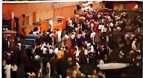
► Contraste entre el paisaje rural y el paisaje urbano.